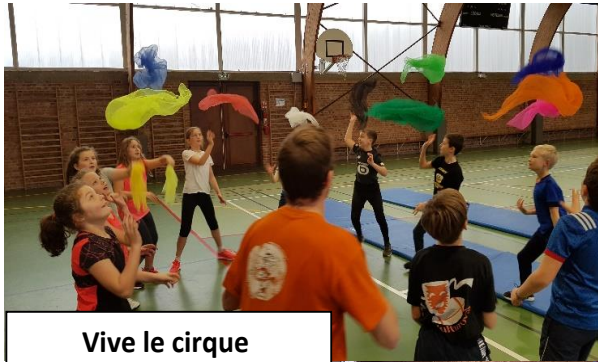
Vive le cirque à l'école Saint-Joseph !

Si votre enfant est né en 2018, pensez à prendre RDV au 06.74.97.04.49